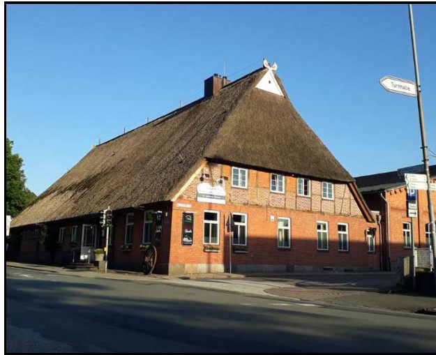
Landhaus „Siemers“ mit Restaurant Rosalie

Breitenfelde ist eine Gemeinde im Kreis Herzogtum Lauenburg in Schleswig-Holstein und liegt ca. 5 km südlich von Mölln am Elbe-Lübeck-Kanal. Das Dorf wurde im Ratzeburger Domkapitelverzeichnis 1194 zum ersten Mal als Kirchspiel urkundlich erwähnt. Breitenfelde lag an der historischen Alten Salzstraße von Lüneburg nach Lübeck. Heute leben ca. 2000 Einwohner in Breitenfelde.